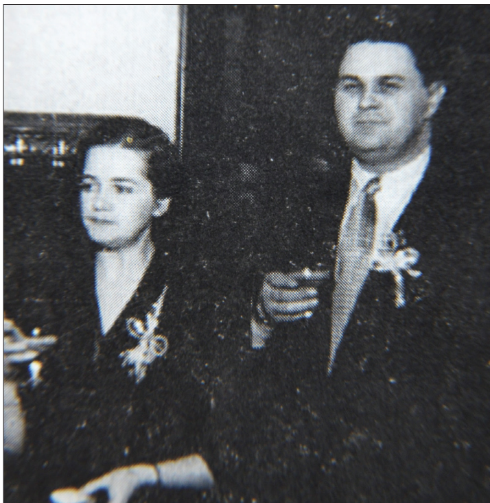
24 octombrie 1942 – căsătoria lui Corneliu Coposu cu Arlette Marcovici