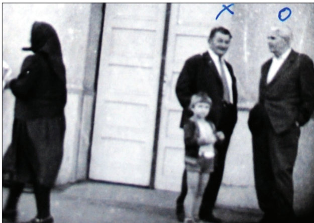
Sub lupa Securității