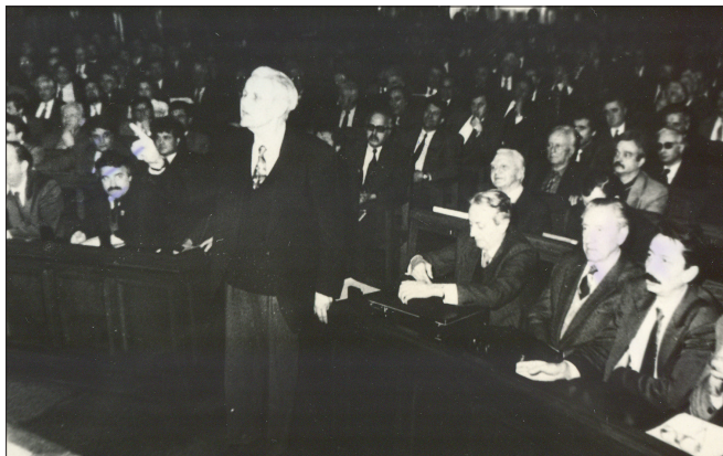
În Parlamentul României