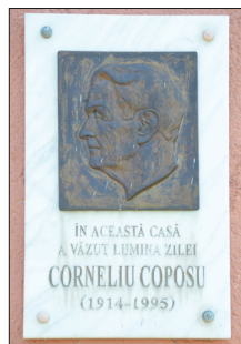
Placa memorială instalată pe casa în care s-a născut Corneliu Coposu