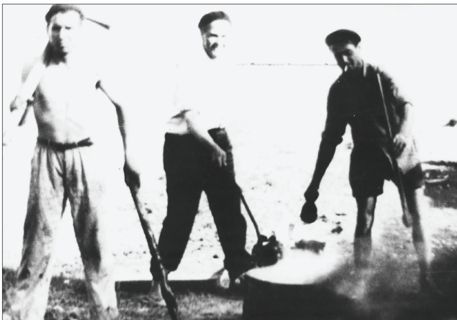
În Domiciliul Obligatoriu (1962-1964)