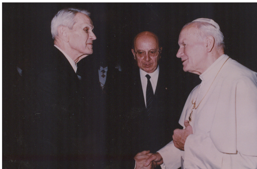
În vizită la Papa Ioan Paul al II-lea, la Vatican