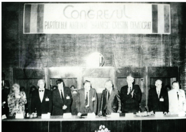
Congresul PNȚCD – septembrie 1991