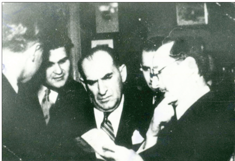
Împreună cu alți fruntași național-țărăniști