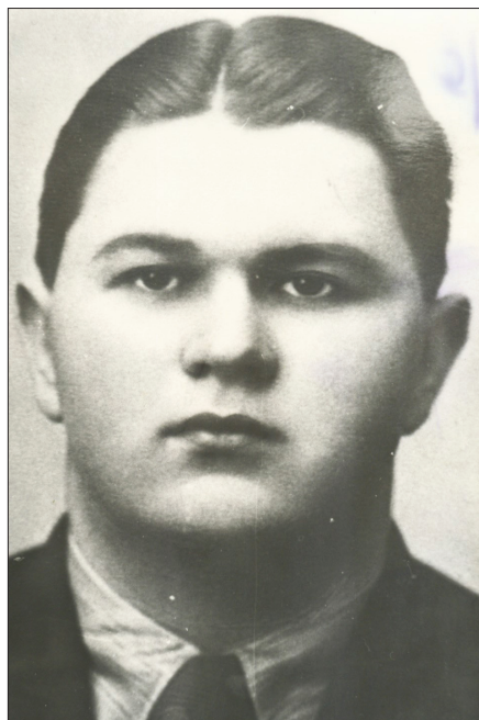
La absolvirea liceului din Blaj

Deși înaintașii săi au îmbrățișat cariera preoțească, Corneliu Coposu a fost lăsat să-și aleagă singur viitoarea profesie. Astfel, în anul 1930, la vârsta de numai 16 ani, Corneliu Coposu se înscrie la Facultatea de Drept din Cluj, pe care a absolvit-o în anul 1934.