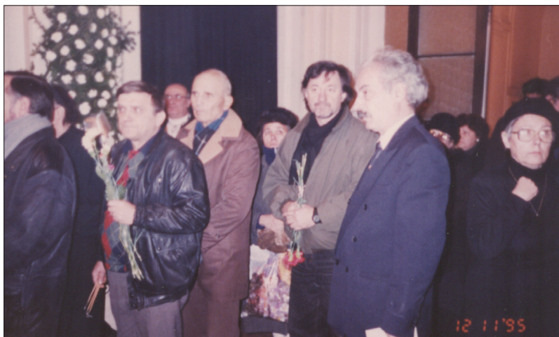
Actorul Ion Caramitru și Radu Vasile, viitorul prim-ministru al României, la catafalcul marelui dispărut

Mulți români realizează că personalitatea lui Corneliu Coposu, la fel ca a multor alte mari genii ale poporului român, a fost percepută la reala sa valoare doar după ce a trecut la cele veșnice. Marii oameni politici occidentali, însă, i-au recunoscut adevărata sa valoare. Noi, din păcate, nu. Aceasta face parte din mentalitatea noastră românească, de a ne da seama de adevărata valoare a unor mari personalități, după cum a fost și Corneliu Coposu, doar după ce nu mai sunt printre noi.