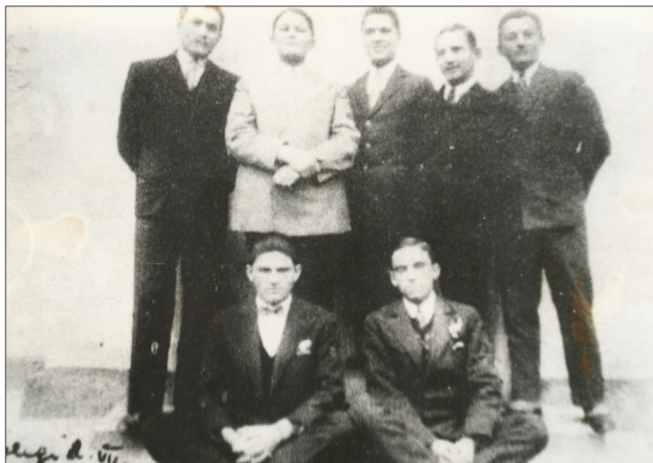
Împreună cu colegii de la Liceul „Sfântul Vasile cel Mare” din Blaj

Deși înaintașii săi au îmbrățișat cariera preoțească, Corneliu Coposu a fost lăsat să-și aleagă singur viitoarea profesie. Astfel, în anul 1930, la vârsta de numai 16 ani, Corneliu Coposu se înscrie la Facultatea de Drept din Cluj, pe care a absolvit-o în anul 1934.