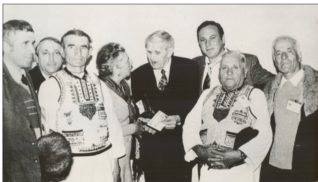
De vorbă cu țărani