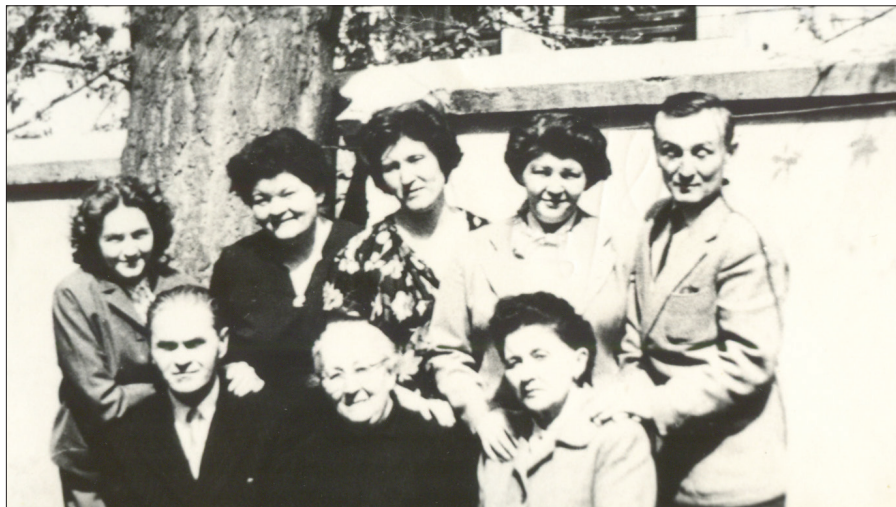
Familia Coposu reunită după perioada închisorilor – 1964

Închisoarea lui Corneliu Coposu nu s-a sfârșit în anul 1964, ci a continuat până în decembrie 1989. A fost în permanență urmărit de către organele Securității Statului. A avut parte de 27 de percheziții domiciliare, cu repetate rețineri la Securitate. Aici a fost chemat și interogat de sute de ori, obligat să scrie nenumărate declarații pentru a răspunde la acuzațiile de complot, tentativă de destabilizare a ordinii în stat, sabotaj, propagandă ostilă orânduiri etc. La perchezițiile domiciliare i se confisca tot ce scria și astfel i-au fost distruse o serie de scrieri, în special istorice, de mare valoare documentară.