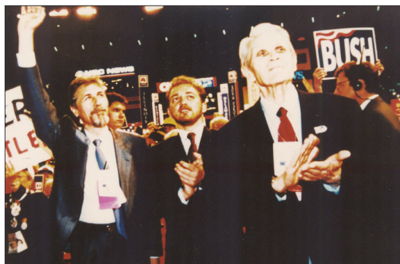
În SUA, împreună cu viitorul președinte al României, Emil Constantinescu