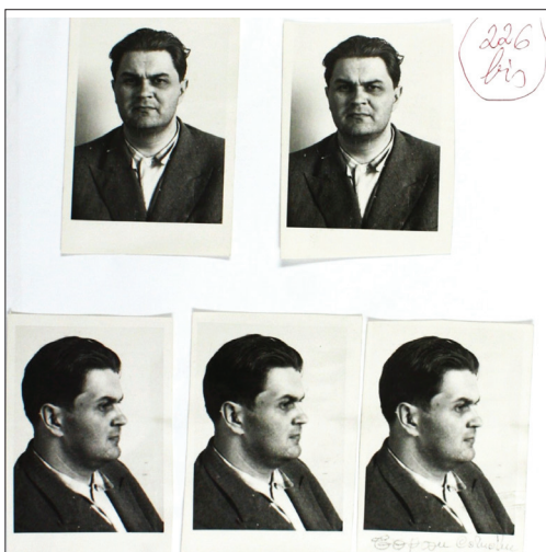
Arestarea lui Corneliu Coposu – 14 iulie 1947

Timp de opt ani de zile, până în anul 1955, Corneliu Coposu a fost ținut, în mod abuziv, în arest preventiv prelungit, fără a fi judecat, după care i se intențază un proces tipic stalinist, în care sentința era fixată de dinainte. A fost condamnat pentru „înalta trădare a clasei muncitoare”, o aberație legislativă inventată de către comuniști.