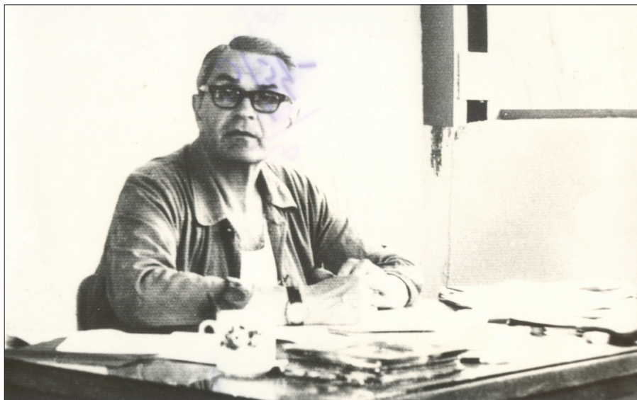
Corneliu Coposu la masa de scris

Am considerat că perioada clujeană, cea de redactor la ziarul „România Nouă”, cuprinsă între anii 1935-1938, este o perioadă distinctă din cariera jurnalistică a lui Corneliu Coposu. Este perioada de debut, dar și cea mai prolifică. Între 17 octombrie 1935 și 19 aprilie 1938 a reușit să publice, în coloanele ziarului clujean, aproximativ 200 de articole, fără a deveni un jurnalist de duzină.