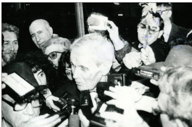
Interviu acordat presei