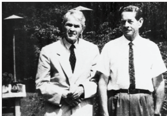
Împreună cu Regele Mihai la Versoix