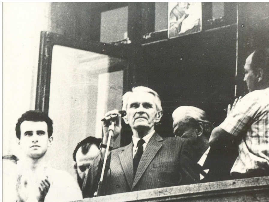
De la balconul din Piața Universității – mai 1990

În urma alegerilor parlamentare din 27 septembrie 1992, Corneliu Coposu este ales senator PNȚCD de București.