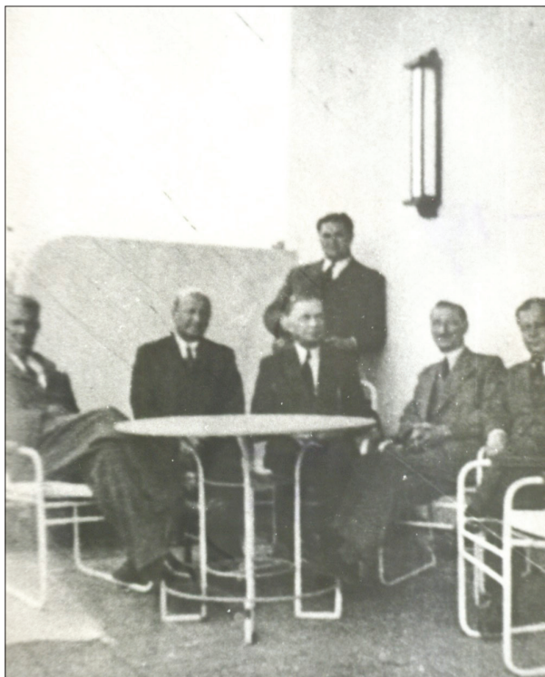
20 iunie 1944 – înființarea Blocului Național Democrat, care va realiza actul de la 23 august 1944, eveniment istoric la care a participat și Corneliu Coposu, alături de Iuliu Maniu