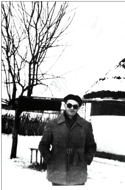
În Domiciliul Obligatoriu din Bărăgan, în fața „bojdeucii” în care a fost repartizat

A fost eliberat din închisoare abia în anul 1964, când are loc, la intervenția Occidentului, amnistierea tuturor deținuților politici din România.