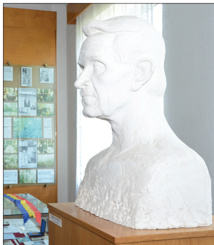
Sala Corneliu Coposu – Centrul Cultural „Șincai-Coposu” din Bobota