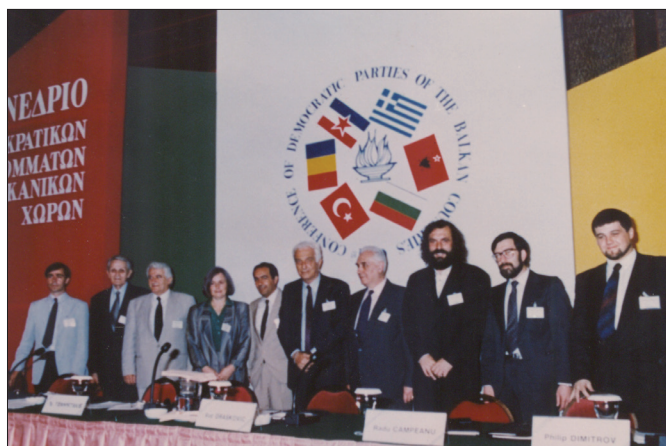
În Grecia, la Congresul partidelor creștin-democrate din Europa