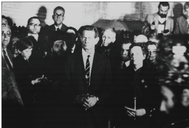
Alături de Regele Mihai – 1992

După ce poporul român a fost intoxicat vreme de 43 de ani cu istorie falsificată prin omisiuni și denaturări, el se află fără vina sa în situația de a nu cunoaște propria lui istorie și ca urmare nu se poate pronunța asupra unei probleme de importanță capitală înainte de a cunoaște adevărul întreg, înainte de a fi lămurit prin prezentarea adevărului care i-a fost ascuns. De aceea, referendumul va trebui să fie organizat de un guvern independent, neutru, cu garanții depline de obiectivitate”.